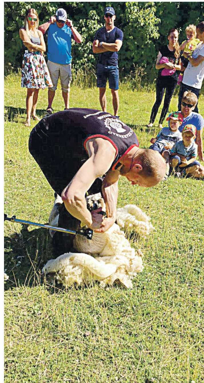
Valge lamba pügamine Välja talus.