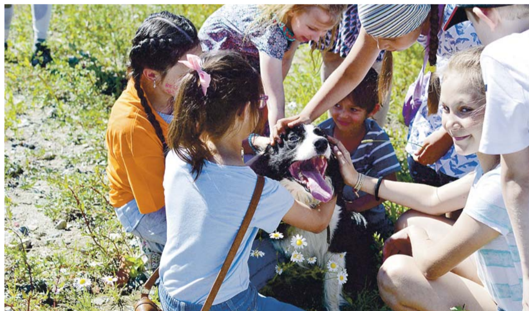
Karjakoer oli laste lemmik.