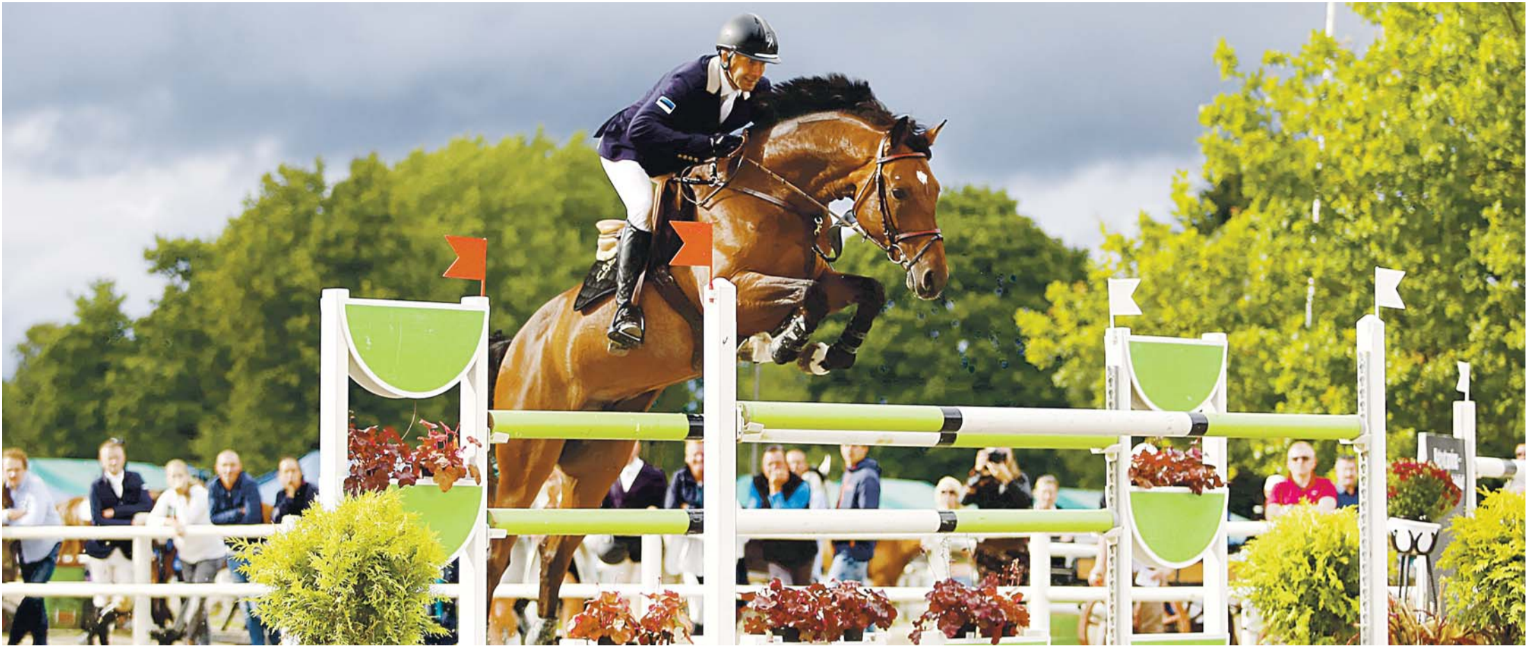
Rebala Tallid püstitasid ka avatud talude päevad külastajate rekordi, kus vastuvõtjad pidid hakkama saama rohkem kui paarituhande huvilisega. Rebala tallid meeskond avatud talude päeval.