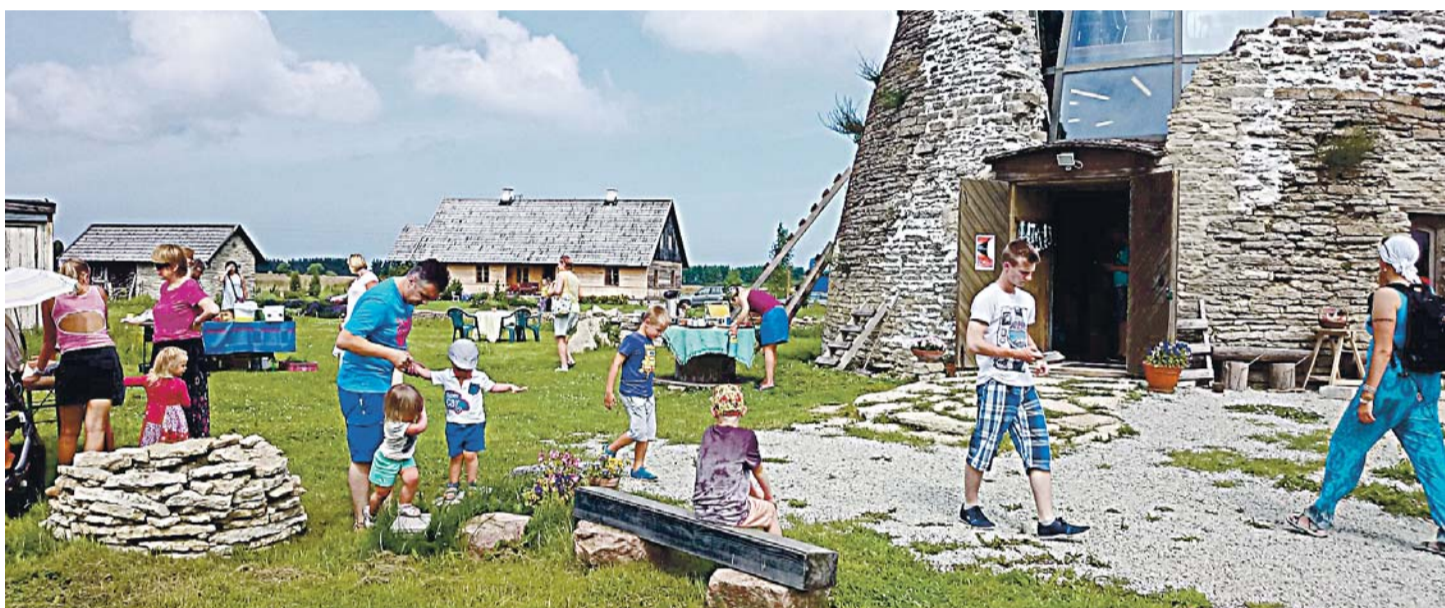
Talude päev Ajaveskis.